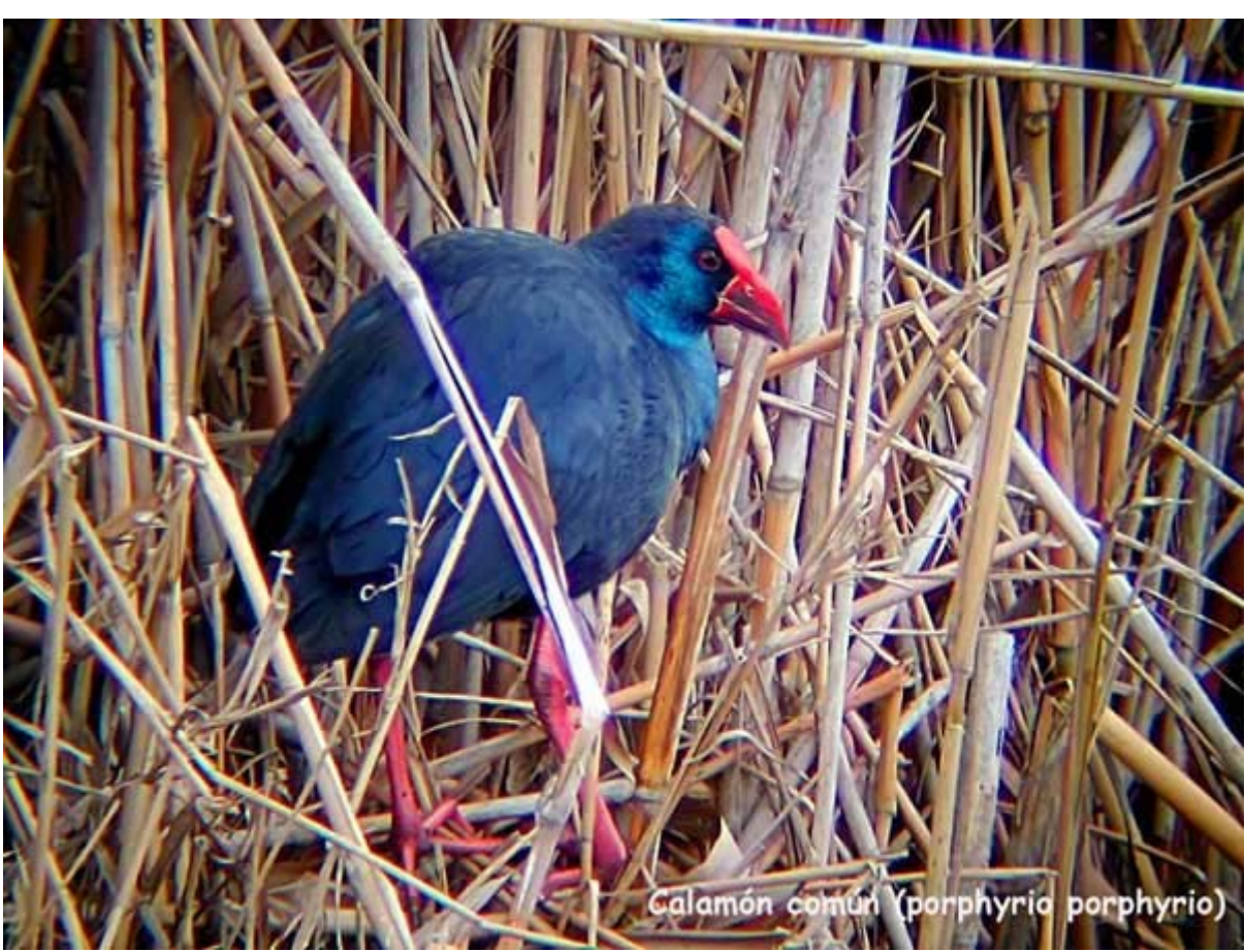
Calamón común (porphyria porphyrio)

Para ver el cambio, pasar el ratón por encima de la foto.